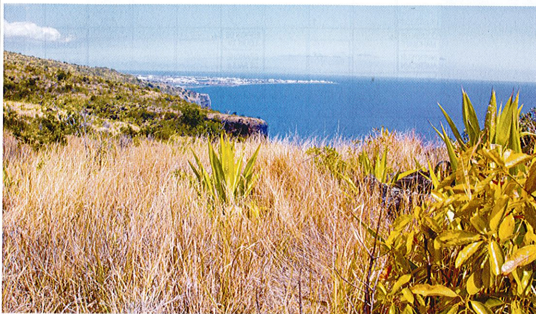
LE CHEMIN DES ANGLAIS, SUR LES TRACES DE L'HISTOIRE DE LA RÉUNION

BAPTISÉ AINSI, PARCE QU'IL AVAIT ÉTÉ EMPRUNTÉ PAR LES ANGLAIS LORS DE LEUR DÉBARQUEMENT À LA RÉUNION EN 1810, CE CHEMIN, APPELÉ ÉGALEMENT CHEMIN CRÉMONT EXISTE DEPUIS 1730. LA ROUTE, PAVÉE EN 1775, PERMETTAIT DE GRAVIR LA MONTAGNE POUR RELIER SAINT-DENIS ET LA POSSESSION. FLJ